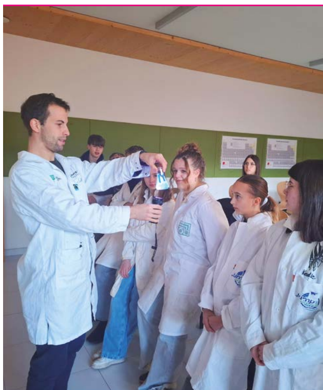
Am Holztechnikum Kuchl untersuchten Schülerinnen und Schüler der MS Kuchl die fluoreszierende Wirkung der Kastanie