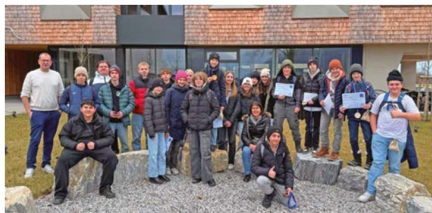
Schülerinnen und Schüler der MS Kuchl zu Besuch am Holztechnikum Kuchl