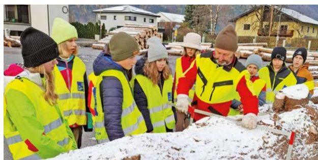
Die Schülerinnen und Schüler können die Volumsberechnung anhand eines praktischen Beispiels eines Rundholzstammes selbst durchführen